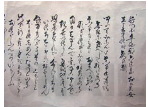
「詩」を書き綴った巻物 西教寺 蔵

聞いてみなんせ まことの道を 無理なおしえじゃ ないわいな まこときくのが おまえはいやか なにがのぞみで あるぞいな