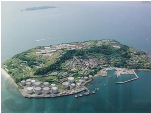
山口県下関市 六連島

山口県下関市六連島の「お軽さん」(1801~1857年)。結婚後、夫は、浮気をして家に帰ってこなくなった。子供を連れて自殺まで考えたが、燃え盛る瞋恚のころを、阿弥陀さまと共に、お念仏のある生活に帰依していかれました。