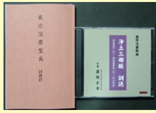
大無量寿経 観無量寿経 阿弥陀経 小観経 (阿弥陀経)

「訓読」は少しでも「わかるお経」というテーマから、漢文を訓読（日本語で読み下したもので録音しました。訓読という始めての試みは、どのように読んだらよいか、一例として参考になります。また心しずかに耳を傾けて聞くだけで、お経の意味がわかってきます。経文の抄（抜き書き）は大谷派の昭和法要式に依りました。