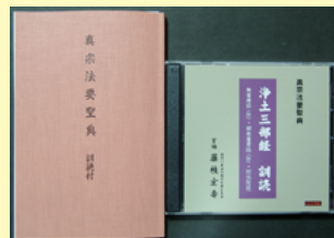
大無量寿経 観無量寿経 阿弥陀経 小観経 (阿弥陀経)

「訓読」は少しでも「わかるお経」というテーマから、漢文を訓読（日本語で読み下したもの）で録音しました。訓読という初めての試みは、どのように読んだらよいのか、一例として参考になります。また心しずかに耳を傾けて聞くだけで、お経の意味がわかってきます。経文の抄（抜き書き）は大谷派の昭和法要式に依りました。