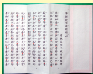
大無量寿経 観無量寿経 阿弥陀経

大経 上・下、観経、阿弥陀経の4巻すべてを、抜き書き(抄)なしに読んだものです。旧来は大切な法要などで、この本三部経を誦していましたが、最近では全巻をまとめて読むことは稀なようです。しかし、毎日の繰り読みなど、何らかの形で本三部経を読んでおられるところもあり、真宗僧侶のたしなみとして練習される向きに、本CDの利用価値があります。録音は一句一句正確な発音で録音しており、スピードも法要の時に読む早さになっています。門徒一般の方は、めったに聞けない『本三部経』に遇える絶好のCDです。